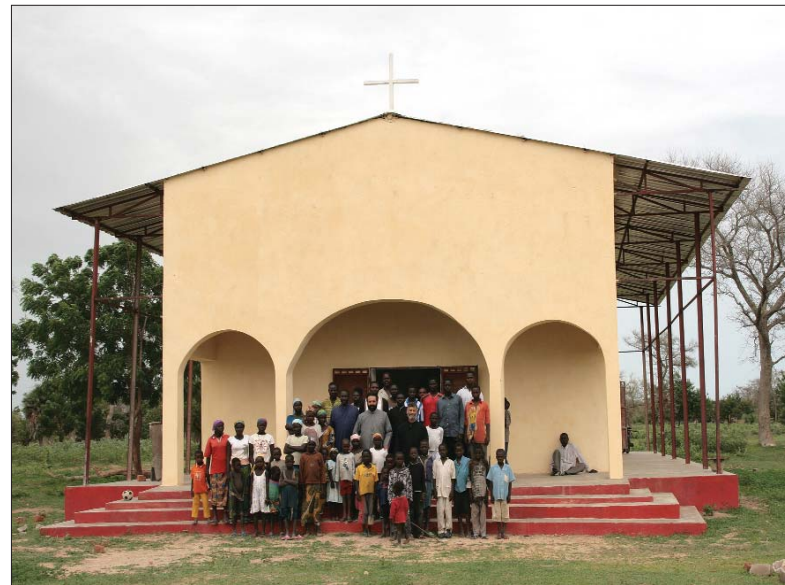
Πάντα τά έθνη

Ή πολυγαμία –(θέμα άκόμη άθικτο)– καί ή έθιμική πρακτική τών παραδοσιακῶν γάμων, εύρέως διαδομένη σέ όλλες σχεδόν τίς φυλές είναι ένα πρόβλημα πού έμφανίζει ένα ποσοστό μόνον 10% τών πιστῶν τής Ρωμαιοκαθολικής καί αλλήλων όμολογιῶν νά έχουν συνάψει θρησκευτικό γάμο καί ένα αλλιο 30% μόνον πολιτικό γάμο. Τοῦτο δέ, διότι ή οικογένεια τής γυναίκας δέν επιτρέπει τήν τέλεση θρησκευτικοῦ ή πολιτικοῦ γάμου άν δέν αποπληρωθεῖ ή προίκα εκ μέρους του γαμπροῦ. Ό γαμπρός λαμβάνει από τήν οικογένεια τής νύμφης μία λίστα προίκας, πού πρέπει νά αποδώσει. Συνήθως αποδίδει άμέσως ένα 10% τής προίκας, παίρνει τή γυναίκα, τεκνοποιεί καί μετά από χρόνια όταν θά έχει ξεπληρώσει καί τό υπόλοιπο 90%, θά επιτραπεί από τήν οικογένεια νά γίνει πολιτικός καί θρησκευτικός γάμος. Έτσι, λοιπόν, θά πρέπει ή κατηχητική μας προσπάθεια νά δια-